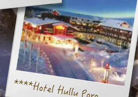
****Hotel Hullu Poro