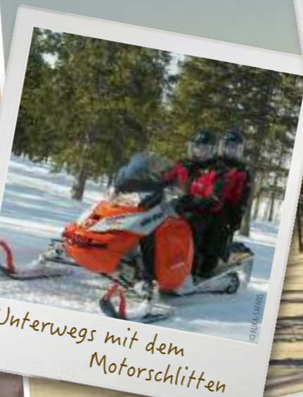
Unterwegs mit dem Motorschlitten